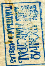
Caja 2-5. Bandos y Decretos. Sobre cautividad de Fernando VII