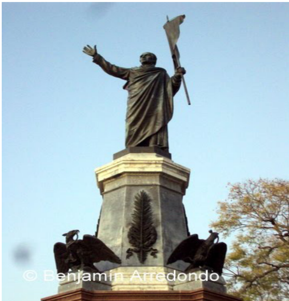
Monumento a Hidalgo en Pénjamo, Gto.