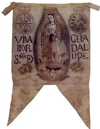
9. ESTANDARTE UTILIZADO POR LAS TROPAS INSURGENTES DE HIDALGO, 1810-1813.