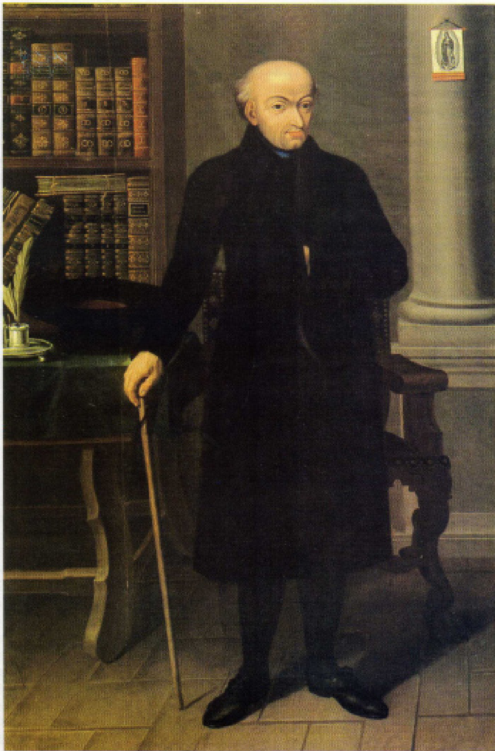
Don Miguel Hidalgo y Costilla. Pintura al óleo.

Caja 2-6 Decreto sobre la cautividad del rey de España Fernando VII Pag. 2